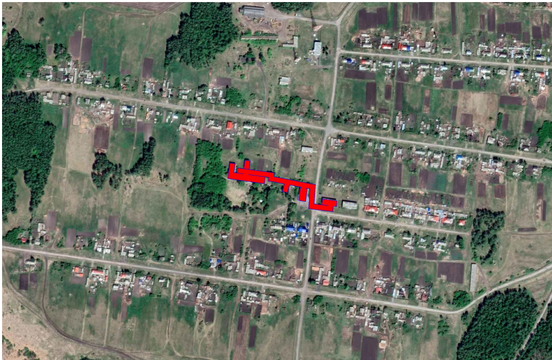
Рисунок 1.1 – Существующие зоны действия источников теплоснабжения на территории села Тавричанка